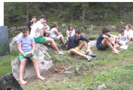
Due momenti della Messa durante una passeggiata