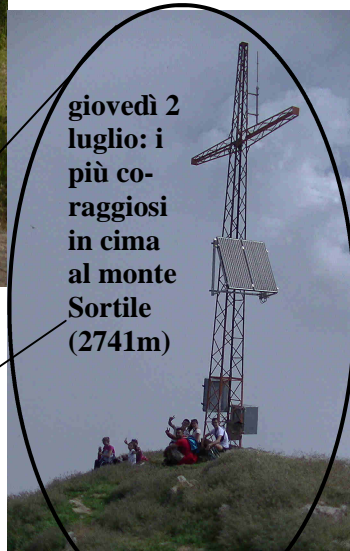
giovedì 2 luglio: i più coraggiosi in cima al monte Sortile (2741m)