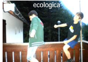
Moto GP Daone, cilindrata ecologica