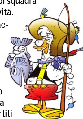
Ed eccoli qua i boys