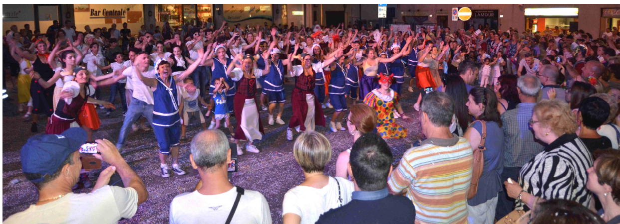
7 giugno — Festa di inizio estate con l'Oratorio e i carri di carnevale: i belli e i balli.