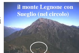
il monte Legnone con Sueglio (nel cerchio)