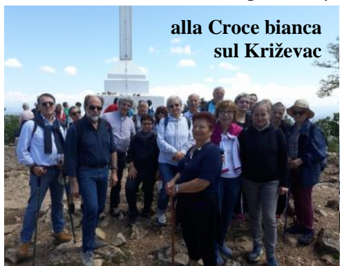
alla Croce bianca sul Križevac

Siamo andati e... ritornati da Međugorje. Siamo andati per pregare, per lasciarci abbracciare dalla Madre di Dio e Madre di ogni discepolo di Cristo.