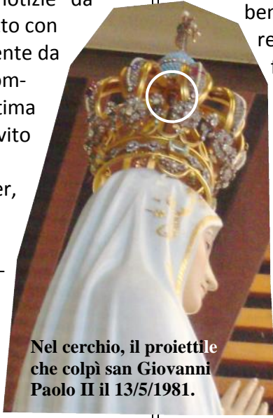
Nel cerchio, il proiettile che colpì san Giovanni Paolo II il 13/5/1981.

gente. Immagini quindi simboliche, spesso da non prendere alla lettera, ma da “spiegare” e interpretare. Il “segreto” di Fatima nasconde una buona notizia e un avvertimento che non è una minaccia, piuttosto una constatazione. L'avvertimento della Vergine è che l'uomo è pienamente responsabile delle sue azioni che possono portare molto male nel mondo, soprattutto quando il suo cuore si allontana dal bene, da Dio. Così scoppiano le guerre, ci sono ingiustizie e la pace va in frantumi. Puntualmente la cosa si è avverata con la seconda guerra mondiale e, in positivo, con il ritorno a Dio di popoli atei come quelli sotto il dominio russo, molti muri sono caduti e un periodo più pacifico in Europa è in atto. Addirittura si è costituita l'Unità Europea, il cui simbolo sono dodici stelle gialle in campo blu, proprio come fossero il logo della “Donna ammantata di sole e con dodici stelle sul capo” descritta nell'Apocalisse di Giovanni: Maria!