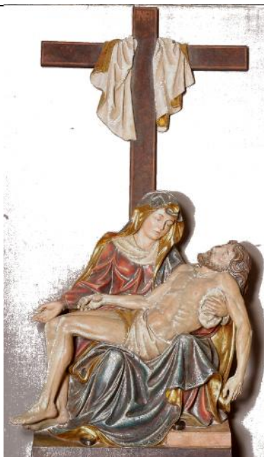
Purtroppo «Ci si abitua a tutto, anche ai risuscitati». Ignazio Silone, Il seme sotto la neve , 1941

Prendiamo al volo questa settimana santa durante la quale possiamo irrobustire la no-