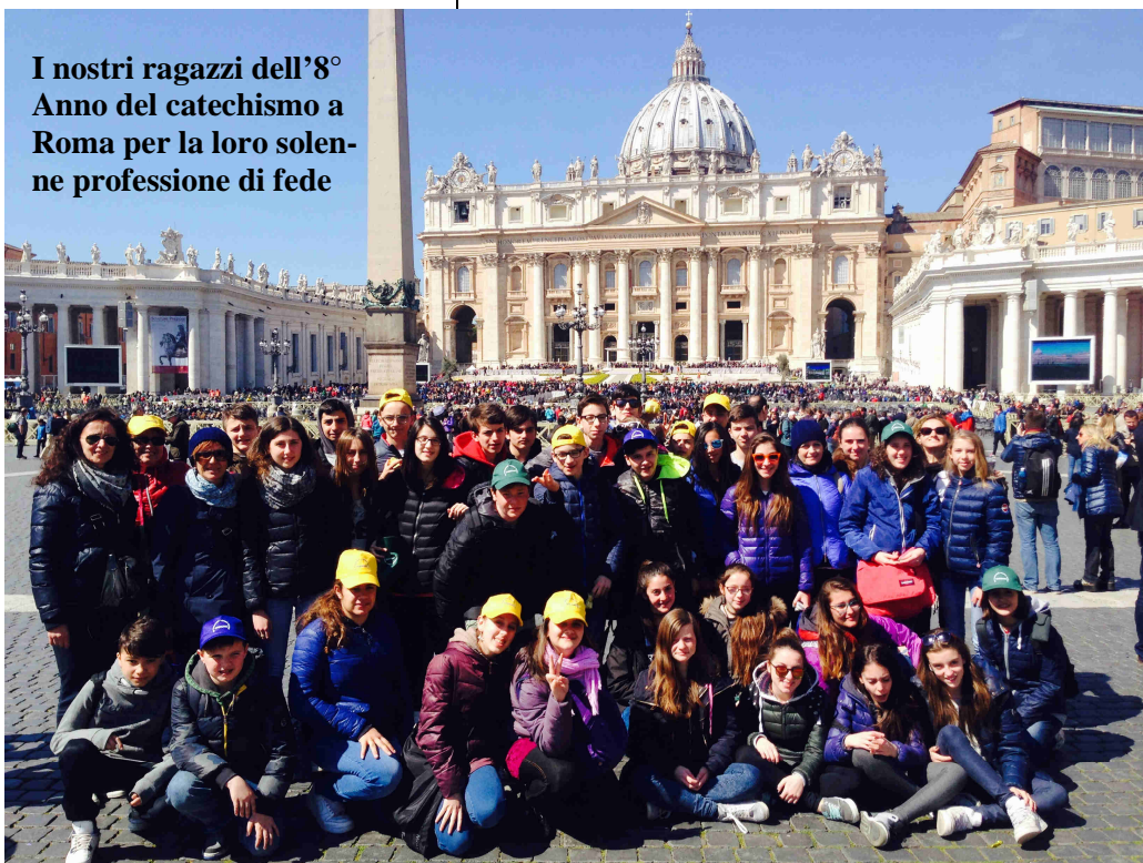
I nostri ragazzi dell'8° Anno del catechismo a Roma per la loro solenne professione di fede

to per dare ai preti il necessario per vivere, fossero anche parroci di un paesino di poche anime (ma su questo chiarisco più sotto). Insomma quello che la Chiesa cattolica incamera dallo Stato viene prevalentemente rigirato per attività, associazioni, strutture e persone fisiche rivolte ai poveri, oltre che per il recupero e il restauro di chiese, oratori o opere d'arte. Sempre in chiesa lasciamo anche un fascicoletto che riporta alcune delle iniziative che sono state affrontate con i soldi derivati dall'8x1000. Questo materiale si può anche reperire tramite il sito www.8xmille.it . Per quanto riguarda il sostentamento dei preti, funziona più o meno così. È stato istituito un fondo nazionale nel quale confluiscono le offerte (deducibili!!) che si possono effettuare con bollettini postali reperibili in chiesa (nella scatoletta a forma di chiesa). Tale fondo purtroppo non è mai sufficiente per dare il minimo ai singoli preti d'Italia. Per questo, quello che manca lo si recupera dall'8x1000. Certo che se le offerte a sostegno del clero fossero sufficienti ci sarebbero più soldi per altra beneficenza. Non tralasciate quindi di firmare!!