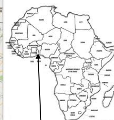
Il Togo nell'Africa